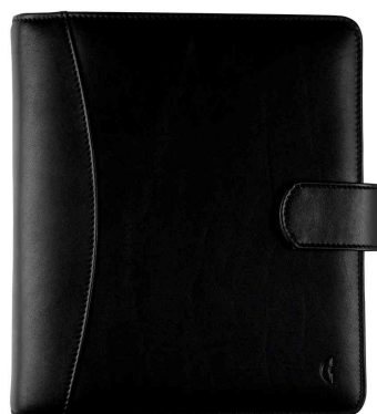
Standard A5 Compact