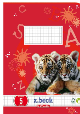
Schulheft x.book, Motiv: Tiger