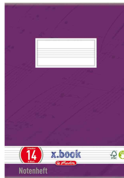
Notenheft x.book, Farbbeispiel