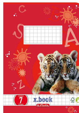
Schulheft x.book, Motiv: Tiger