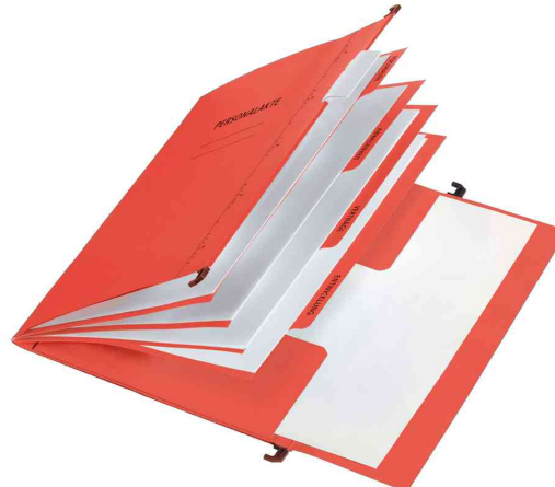
Personalakte, rot - offen