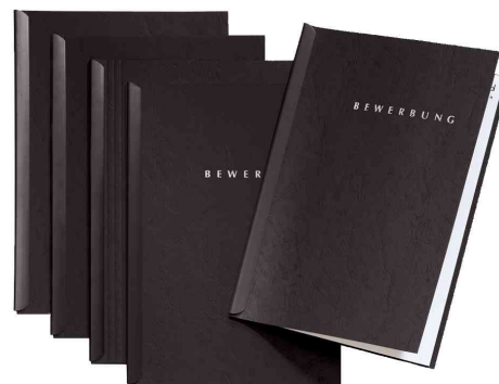
Bewerbungs-Set "Start", schwarz