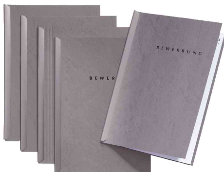
Bewerbungs-Set "Start", grau