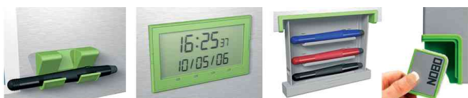
Clip pour stylo - affichage date et heure - boîte extractible - effaceur magnétique

• tableau blanc magnétique inscriptible • surface laquée • surface effaçable à sec • avec un grand espace magnétique à droite pour bloc-notes • avec effaceur magnétique et clip pour stylo • affichage de l'heure et de la date • set d'aimants (comprenant 10 aimants de chacune des couleurs rouge, vert et bleu) et 3 marqueurs pour tableau fournis • cadre en aluminium • avec boîte extractible pour 5 stylos • kit de montage mural fourni