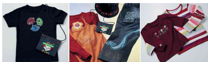
Textilmarker "Textil Painter Plus", Anwendung