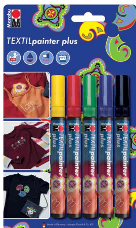
Textilmarker "Textil Painter Plus", 5er Blister