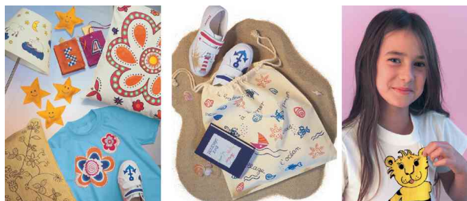
Marqueur de textile "Textil Painter", utilisation