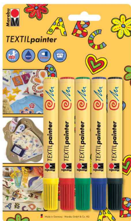
Textilmarker "Textil Painter", 5er Blister