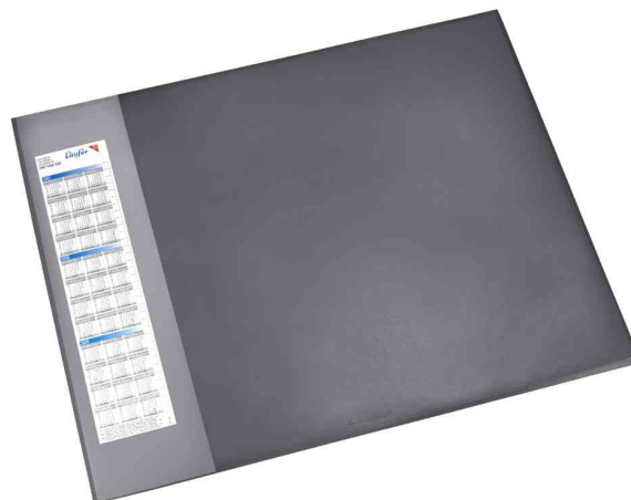
Sous-main DURELLA D1, noir