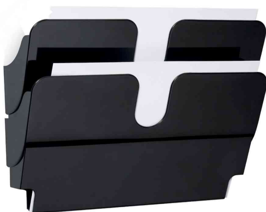
Présentoir mural "FLEXIPLUS 2"

- für die übersichtliche Präsentation von Katalogen, Zeitschriften etc.