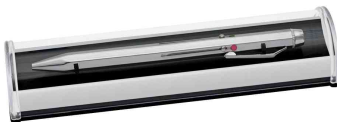
Stylo bille 4 couleurs, dans un étui