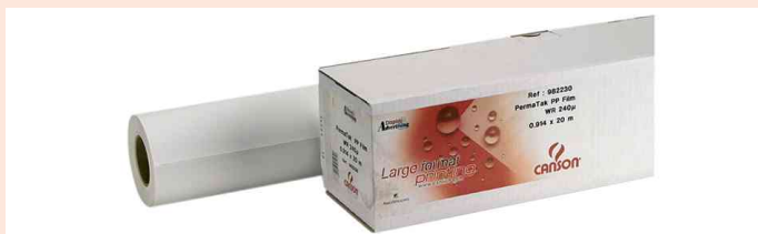
Calque CAD, en rouleau