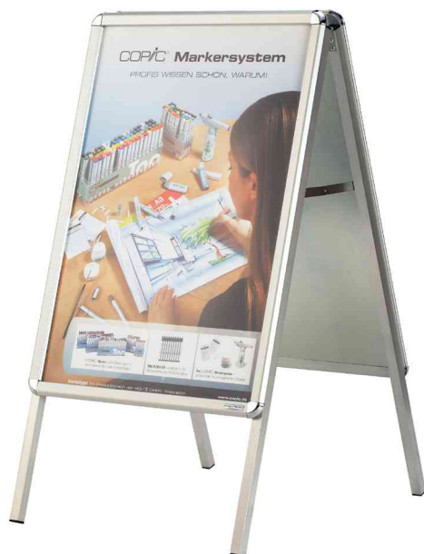
Chevalet publicitaire SP