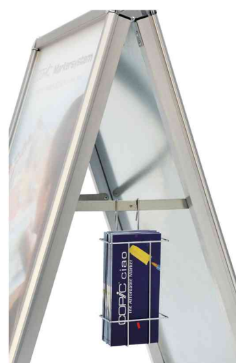
Accessoires: panier métallique suspendu, long