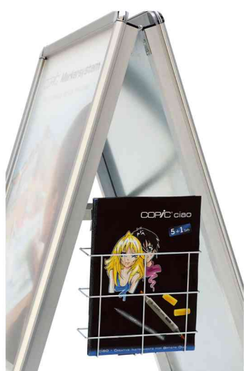
Accessoires: panier métallique suspendu, A4