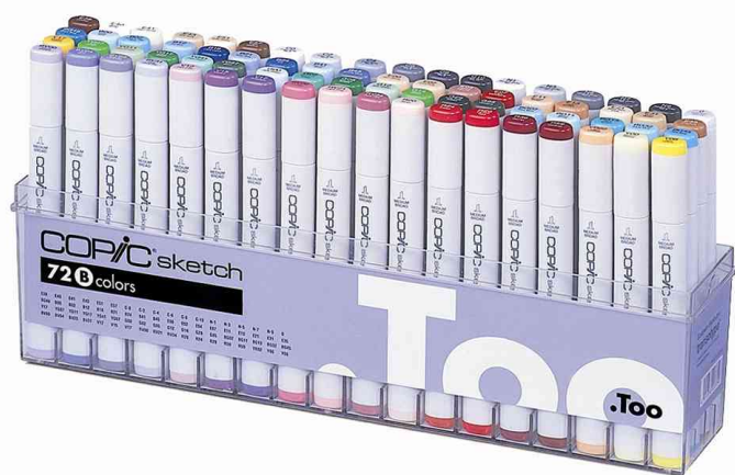
Profi Marker sketch, 72er Set B