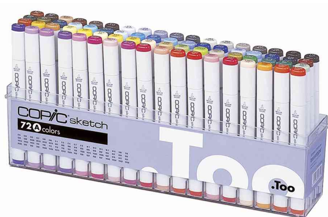
Profi Marker sketch, 72er Set A