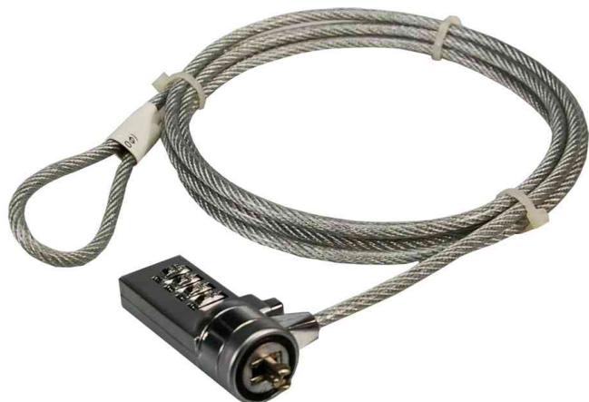
Serrure pour ordinateur portable, avec code numérique

- bureaux, - écoles, universités - hôtels - travailleurs itinérants