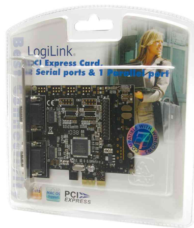
carte serielle PCI express RS-232, emballage