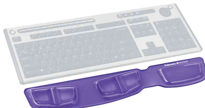
Repose-poignet pour clavier Health-V Crystals, utilisation