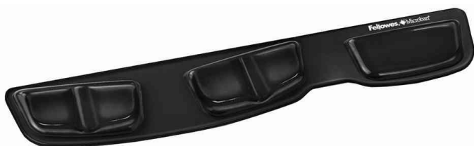
Repose-poignet pour clavier Health-V Crystals

- idéal pour de longues heures de travail à l'ordinateur