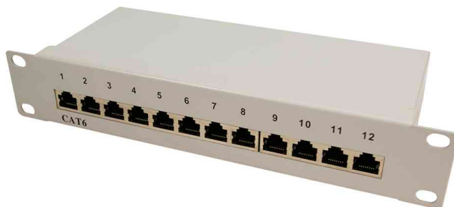
Panneaux de brassage 10" cat. 6