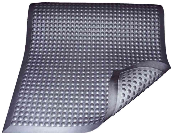
Arbeitsplatzmatte Yoga Ergonomie B1

- Außenlager, Wachposten, Rezeptionen, oder Montageplätzen