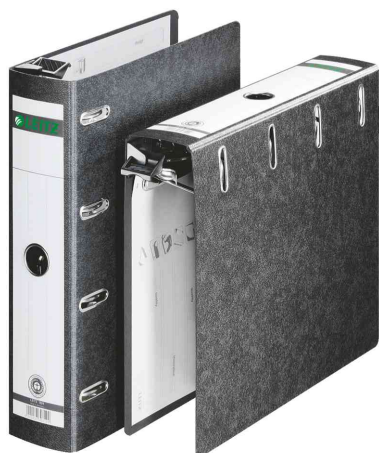
Double classeur suspendu