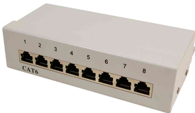
Patch Panel pour bureau cat. 6