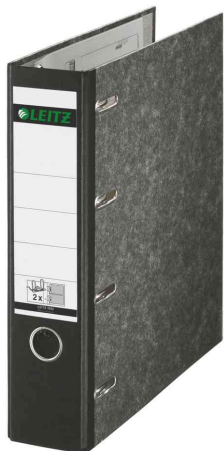
Classeur double à marbre nuagé