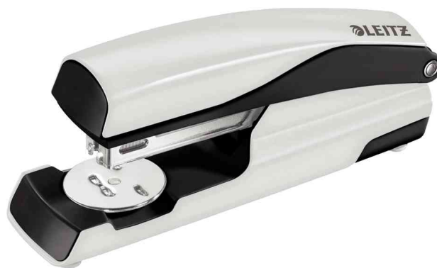
Agrafeuse Nexxt 5502, gris