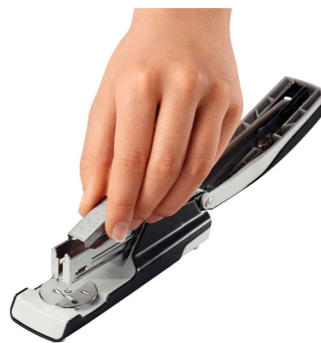
Mécanisme de charge par le haut