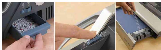
Tiroirs à confettis - butée de taquage réglable - compartiment de rangement extractible avec sélecteur de diamètre