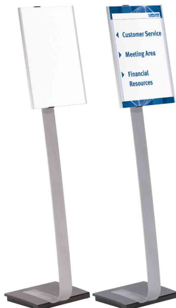
Support d'information INFO SIGN stand, format à la française