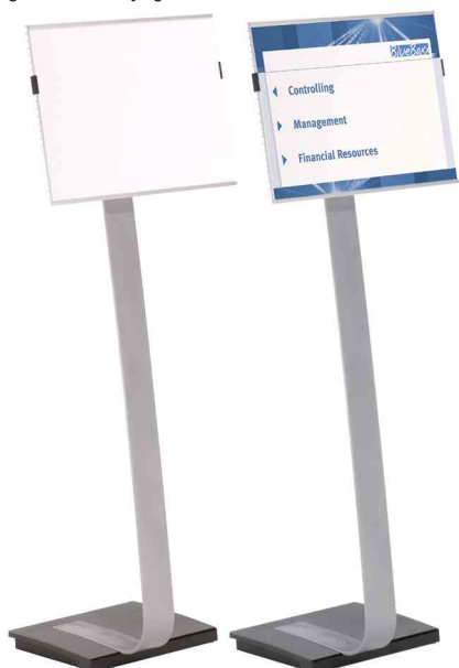
Support d'information INFO SIGN Stand, format à l'italienne