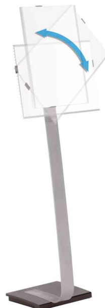
Pivote du format portrait au format paysage