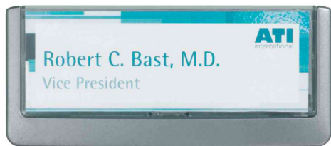
Plaque de portes Click Sing, graphite