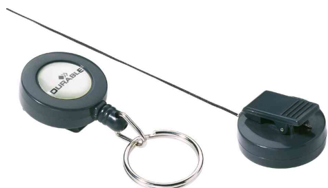
Porte-badge avec anneau métallique