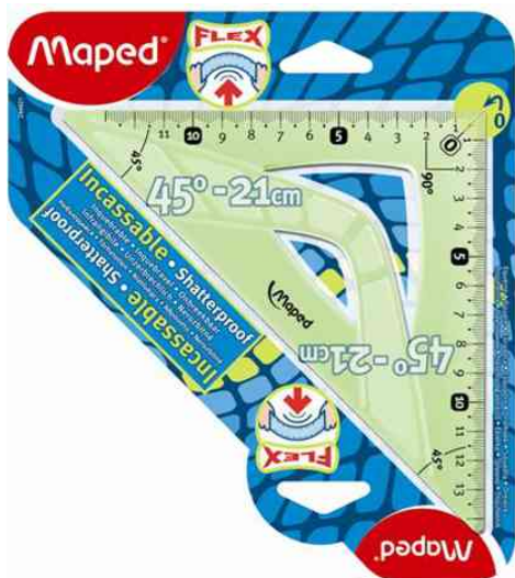
Equerre Flex 45°

- idéal pour être transporter dans un sac