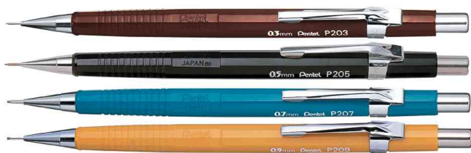
Porte-mines série P200