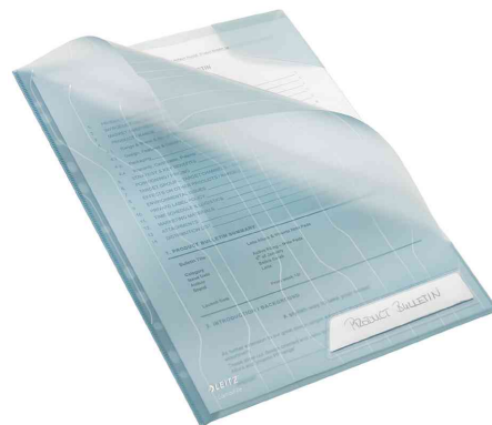
languette de fermeture