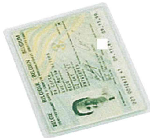
pochette pour papiers d'identité, application