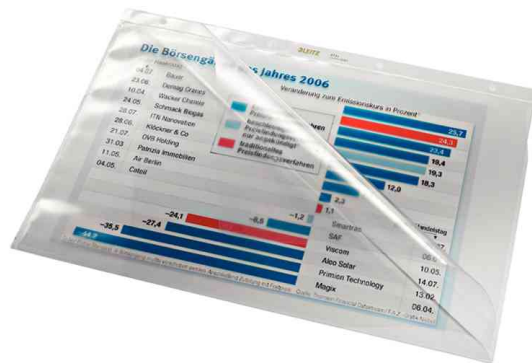
Pochettes perforées de présentation, utilisation