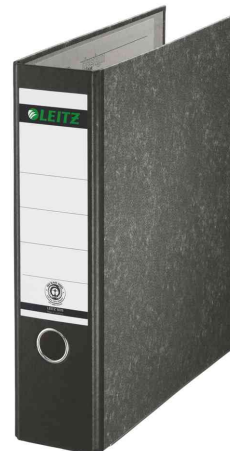
Classeur 180° marbre nuageux 1070