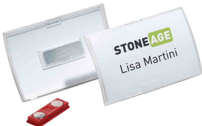
Badge Click Fold, avec aimant