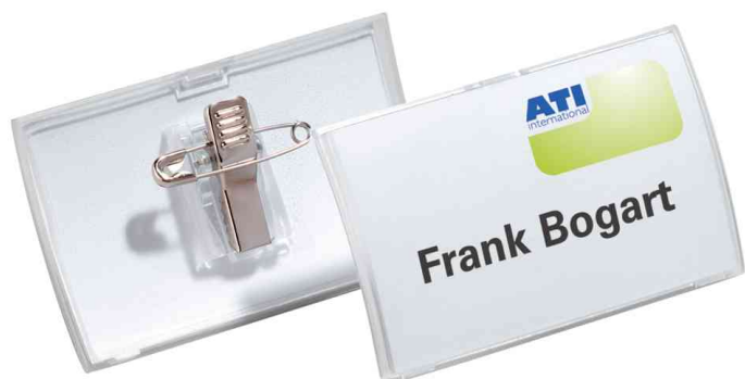
Porte-badges Click Fold, avec pince combi