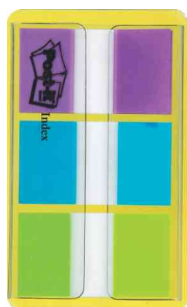
Post-it® Index marque-pages dans un étui-dévidoir, lilas/bleu/vert