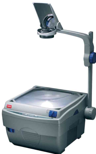
Rétroprojecteur Quantum 2511 / 2521

Quantum 2521: Changeur de lampe pour des expositions sans interruption en cas de défaillance de lampe • poids: 8,15 kg • lampe de rechange compatible: N° de commande 5530957