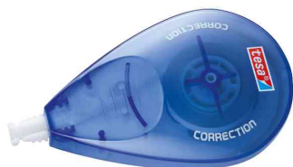
Rouleau correcteur jetable Sideway Roller