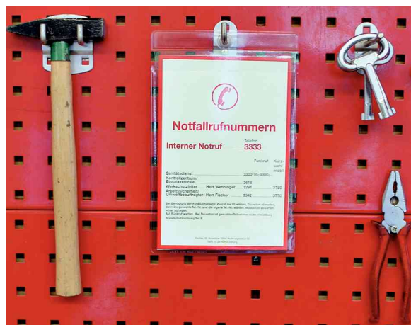
étuis transparents, exemple d'utilisation