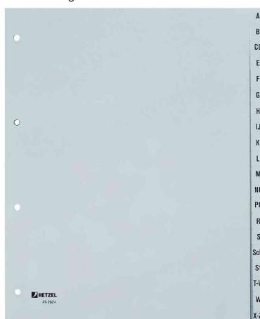
Intercalaires alphabétiques en plastique, 20 positions, extra larges