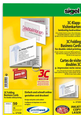
Pc-carte de visites doubles 3c