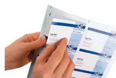
Personnaliser à l'aide du PC - imprimer - décoller