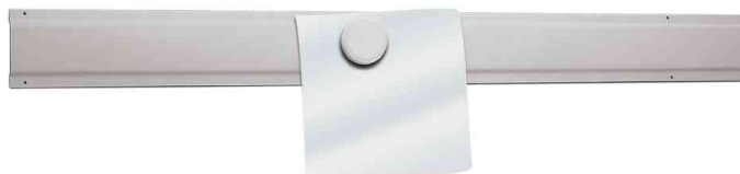
Rail métallique ZA