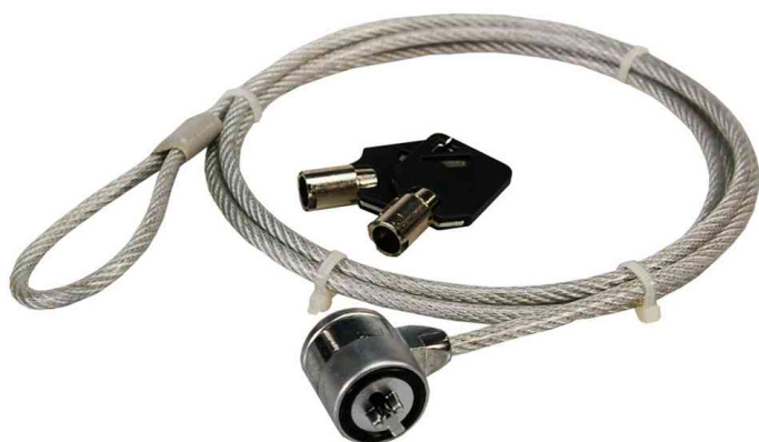
Serrure pour ordinateur portable, avec serrure à clé