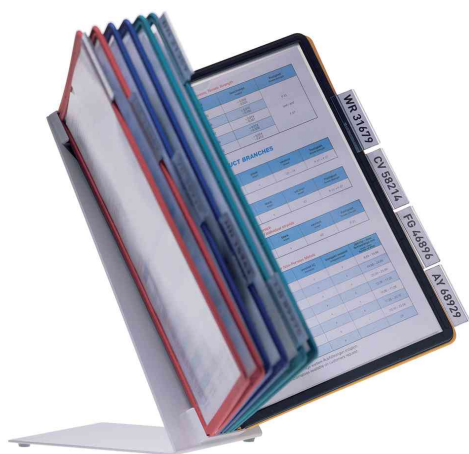
Système de présentation VARIO® table 10, gris