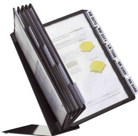
Système de présentation VARIO® table 10, noir