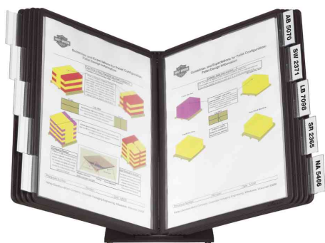
Système de présentation VARIO® table 10, ouvert