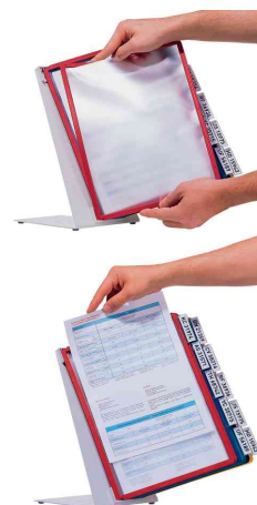
Retrait et ajout facile des plaques pochettes