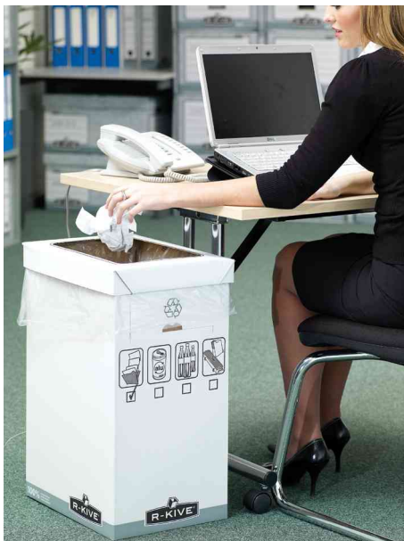
Box de recyclage, utilisation