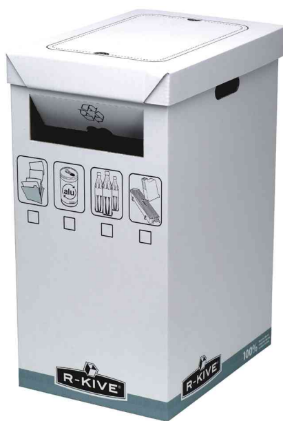
Box de recyclage