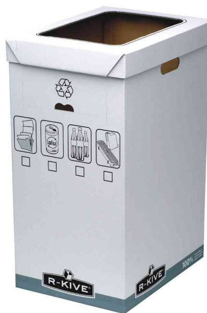
Box de recyclage, ouvert au dessus