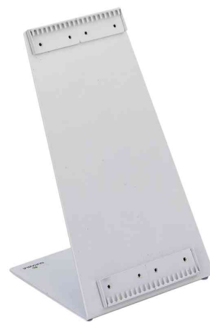
Pupitre de table