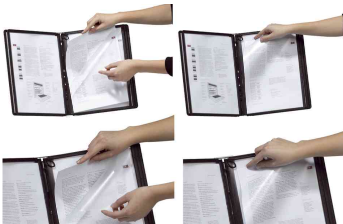
Plaque pochette Panel Plus: changement rapide des documents