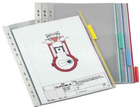
plaques pochettes format A4