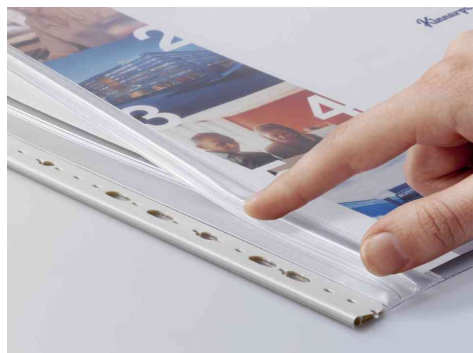
Avec fermeture Zip