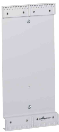
Support mural, pour 20 plaques pochettes