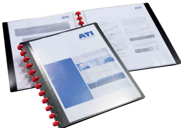
Protège-documents DURALOOK® Easy Plus