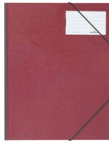
Chemise 3 rabats à élastique Premium, rouge